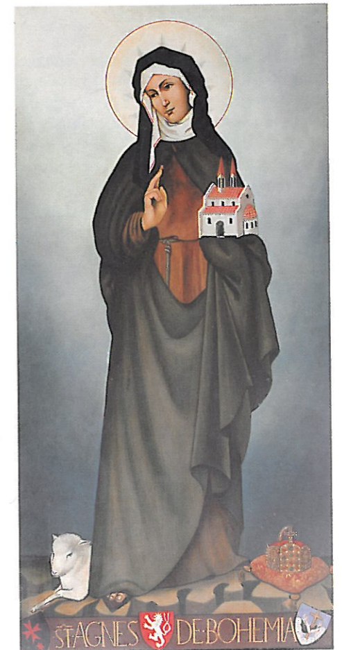
SV. ANEŽKA ČESKÁ 1211 - 1282

Pouk' více než 10 tisíc modlitelů a postlíčů se věřících sradit vypravování vlaků a autobusů z česko- venska na tuto církevní slavnost se stala manifestací naší víry. Skatistů na občanu sledovalo přes slavnosti doma u televize obrazovek a s dopilím nadávali díky Bohu za uměrně útlíku.